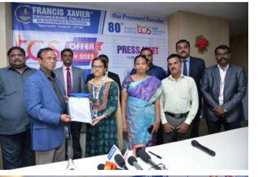
இவ்வாறு அவர் பேசினார்.

ரேங்க் பட்டியலில் தேர்வு செய்து இருக்கிறார்கள். தொழில்நுட்ப கவுன்சில் 4 ஸ்டார் விருதை கல்லூரிக்கு வழங்கியுள்ளது. எனவே, 'படிக்கும்போதே வேலை' என்ற லட்சியத்தோடு மாணவர்களை ஊக்குவிக்கிறோம். முதல் ஆண்டு படிக்கும் போதே மாணவர்கள் சம்பளம் வாங்குகின்றனர். அவர்கள் இறுதி ஆண்டு பயிலும் போது கூடுதல் சம்பளம் கிடைக்கும்.