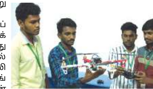
மாணவர்களுக்கு ட்ரோன் இயக்கும் பயிற்சி