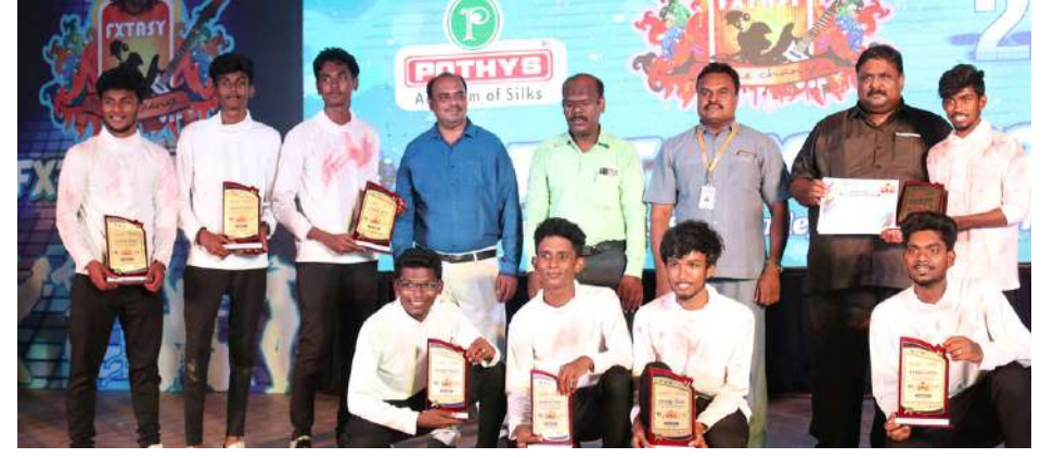
பிரான்சிஸ் சேவியர் பொறியியல் கல்லூரி - போத்தீஸ் இணைந்து மாநில அளவிலான கலைப் போட்டிகள்!